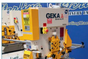
Гибочная станция соответствует нормативам ЕС