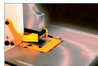
Стол для вырубки прямоугольных пазов, а также опционально пазов в трубе и треугольных пазов