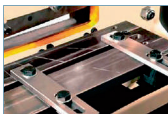
Система рубки полосы с минимальной деформацией и возможностью рубки полки уголка под углом 45°