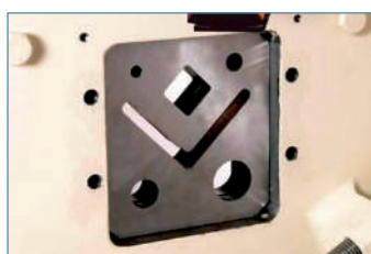
Рубка профилей без потери материала, большой набор проемов для рубки прутка